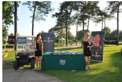
Guarda le foto del servizio